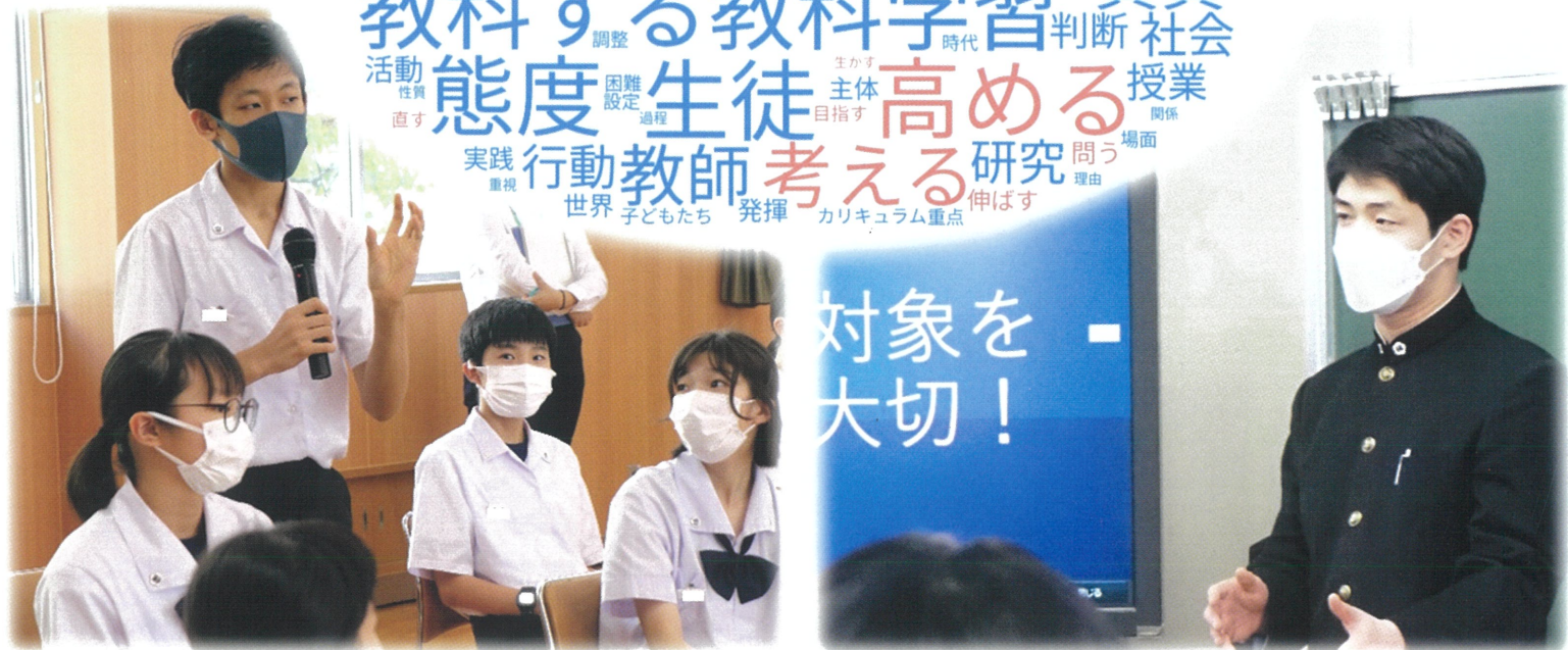
※ユーザーローカル テキストマイニングツール ( https://textmining.userlocal.jp/ ) による分析

日時 令和5年 6月8日(木) 12:30~16:40 (国,社,音,美,保体) 6月9日(金) 9:20~16:40 (数,理,技・家,英,養護)