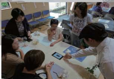
⑧ 接客支援アプリの説明