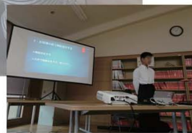
⑨ 郡上高校での接客についてのプレゼン

◇ Good Job 喫茶のコンセプト、『やすらげる おちつける 喫茶』は、生徒ひとりひとりの具体的な課題の達成に向かって、累積、蓄積されたICTツールの活用実践のなかで、支えています。