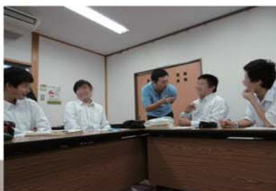
② 個別目標設定に向けてのグループ学習