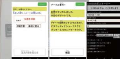
⑤ 喫茶支援システムからのデザート変更