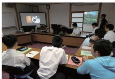
① Good Job 喫茶のコンセプト・接客のイメージ化

岐阜県立郡上特別支援学校では、キャリア教育の一環として、『道の駅 古今伝授の里 やまと』にて喫茶サービス (Good Job 喫茶) の作業学習を行っています。生徒の個別の課題にあわせてキャリア発達を促す ICT ツールを活用した授業実践です。事前学習、喫茶サービス、事後学習で役割を主体的に担い、目指す姿を積み上げていくフィールドになっています。