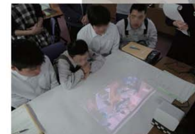
⑦ 事後学習での振り返り動画