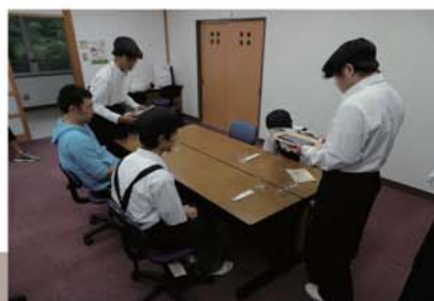
③ 模擬喫茶での接客トレーニング