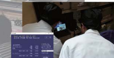
⑥ 喫茶支援システムからの売り上げ状況