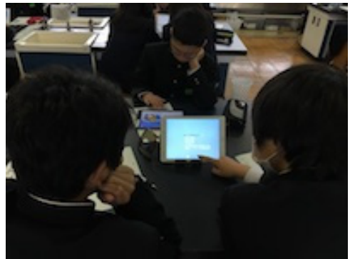
図 8 「Swift Playground」を行う様子

総合的な学習では、第二学年 3 学期の人権学習にて ICT 活用を試みた。人権学習では生徒個々の思いや考えを共有することが思考を深める上で効果的な活動であると位置づけ、協働学習支援アプリケーションであるロイロノート・スクールの提出・閲覧機能の活用を提案した。加えて、これまでの One to One サポートとは異なり、第二学年の担任全員の授業における iPad の活用を提案し、事前にロイロノート・スクールの基本的な使用方法や動画の提示方法など、できる限り授業者が iPad を使用しながら授業を進められるよう、ICT 支援員を中心としたトレーニングを行った。この結果、図 9 に見られるように大半の授業場面で授業者自身が iPad を手に授業を進め、ICT 支援員はロイロノート・スクールの提出時の生徒サポートや選択提示する際のサポートを行った。