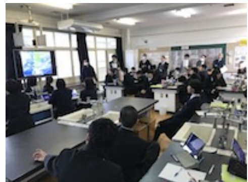
図 11 研究代表者による公開授業

第三回の校内研修会では、次年度以降の校内における iPad 活用の拡大と進展を図る目的で、ICT 支援員である研究代表者が授業公開を行い (図 11) その後授業研究協議を行った。公開授業では、ロイロノート・スクールを用いた画面配信や教材の一斉配布に加え、表現活動における iPad の活用方法といった発展的な活用方法を授業に取り入れて行った。その後の研究協議では、参加した教員に iPad を配布し、実際にアプリケーションを操作しながら授業の中での活用方法について伝達しつつ、それぞれの教科においてどのように活用できるかについてグループ協議を行った。