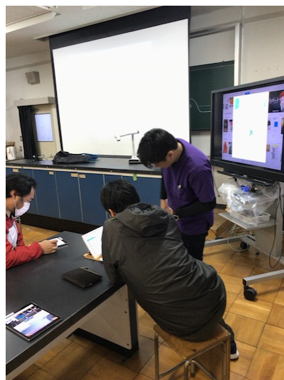
図2 個別サポートの様子

第五期の総合的な学習に関しては、人権学習における ICT 活用を計画し、第二学年の各学級担任全員への ICT 支援を提案した。具体的には、動画の提示と協働学習支援アプリケーションである「ロイロノート・スクール」を活用した生徒の意見集約と共有の2点について iPad の活用を提案し、実際の授業ではロイロノート・スクールの操作全般をサポートした（図4）。