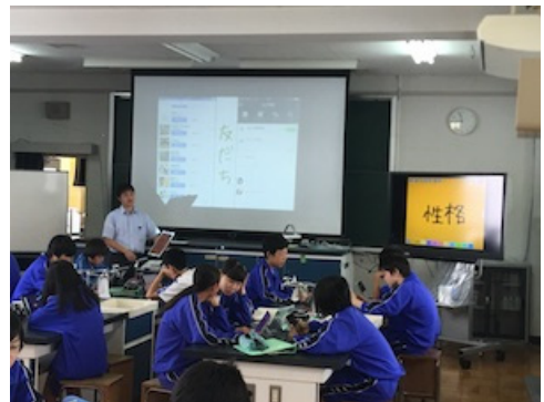
図 9 授業者が iPad を操作する様子