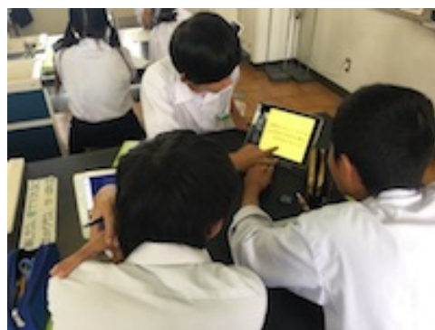
図6 解法を説明する様子

数学の実践では、ロイノート・スクール上で、PDF ファイルで取り込んだ数式に直接書き込む方法や、iPad 上で作図した図形に書き込む方法などを事前に授業者と One to One でトレーニングしたのちに実践に授業では事前に ICT 支援員が iPad と液晶ディスプレイの接続(授業に応じて無線・有線を切り替えて)を行い、数式の解法や図形の提示は授業者自身が行った。図6は授業者が液晶ディスプレイに提示した図形を生徒用 iPad にも配信し、考え方をグループで共有している様子である。授業者が提示したり、書き込んだりする方法を事前に習得していたことで、授業中は ICT 支援員が授業者ではなく生徒をサポートすることができ、単なる提示型の授業から、生徒用 iPad に教材を配信したり、配信した教材に書き込んだりする活動へと高めることができた。