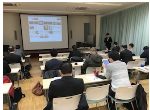
図 10 第二回校内研修会の様子

第二回の校内研修では、第二期までの授業実践の様子を中心に、校内全体で実践状況の共有を行った。方法としては図 10 にあるように ICT 支援員を務めた研究代表者が各実践の様子を動画や画像で伝えつつ、各授業者からのコメントを交えて伝達した。また、実際に授業で活用されたロイロノート・スクールや Keynote、iMovie といったアプリケーションの紹介やグループ単位での活用体験を行った。