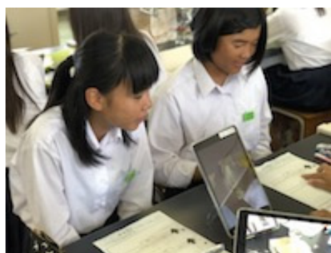
図7 動画を見ながら感想を伝え合う様子

音楽科の実践では、授業実践に向けて音楽室の ICT 環境整備の支援を中心に行った。音楽室に設置されている大型スピーカーから iPad の音声を出力できるように、チューナーと iPad を有線接続し、且つ映像がプロジェクターに出力されるよう整備を行った。また同時に映像再生の方法や動画編集アプリケーションである iMovie を活用して事前に映像を編集する方法を授業者と共にトレーニングした。授業では、授業者が準備した動画を ICT 支援員が生徒用 iPad に配信し、鑑賞した後、生徒が互いに感想を伝え合う活動を行った (図7)。