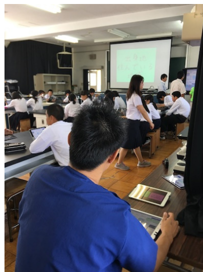
図4 総合的な学習の個別サポートの様子