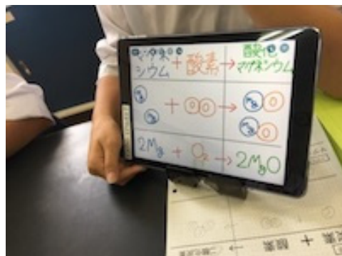
図5 生徒が作成したスライド

理科の実践では、iPad を活用した実験・観察の結果の撮影や動画の提示、実践期間の最後には生徒自身がプレゼンテーションアプリケーションである Keynote を用いてスライドを作成し、グループ内で互いに伝え合う活動を授業実践に取り入れた。図5は生徒が作成したスライドを進めながら説明している様子である。活動では、生徒が実験結果を写真で示しつつ、生じた化学変化を原子モデルで表現する。ICT 支援員は Keynote 上で書き込む方法や、順に表示するアニメーション設定の方法などをサポートしつつ、授業者は内容の助言や実験観察に関する資料の提示を並行して行い授業を進めた。