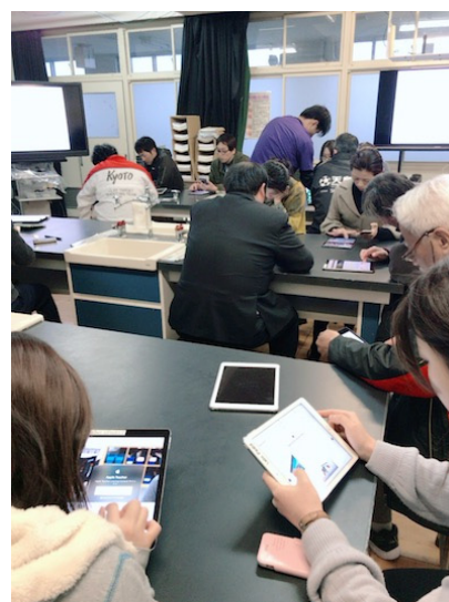
図1 第一回校内研修会の様子

校内において ICT 活用経験が少ない教員を中心に参加を呼びかけ、5月の第一回校内研修会を開催した。研修会では、本研究の概要に加え、具体的にどのような ICT 機器が使用可能で、どのような ICT 支援が行えるのかについて伝達を行った(図1)。iPad を使用するのが初めての教員も多く、右の写真のように推進メンバーを各テーブルに配置し、各テーブルごとに簡単な機能を確認したり、各教科における使用場面について協議を行った。この校内研修会を通じて、年間の授業実践において One to One の ICT 支援を実施する教員を決定した。