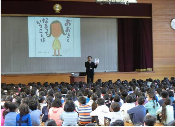
全校朝会では、校長がプレゼンを毎回行った。