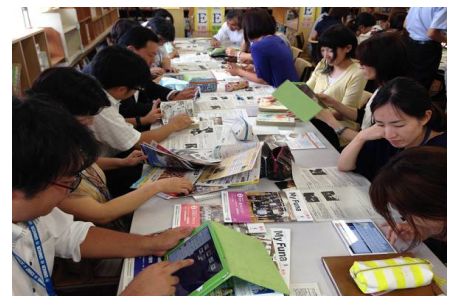
夏季研修で iPad の体験会を実施

これも学校として、職員の ICT 機器活用能力の向上も目指し、様々な企業や実践されてきた方を講師として招き、情報機器への苦手意識を減らす。子供の目線で体験してみる、ということに取り組んだことで、ICT 機器が身近な物と感じられるようになってきたことが、大きな要因となるだろう。また、管理職が率先して ICT 機器を活用して手本を見せ、少しでも取り入れて授業をしている職員がいればその日のうちに良かった点を褒めて次への意欲となるように声をかけていた。今では、ベテラン職員も率先してタブレット端末や教材提示装置を授業に取り入れるようになってきている。