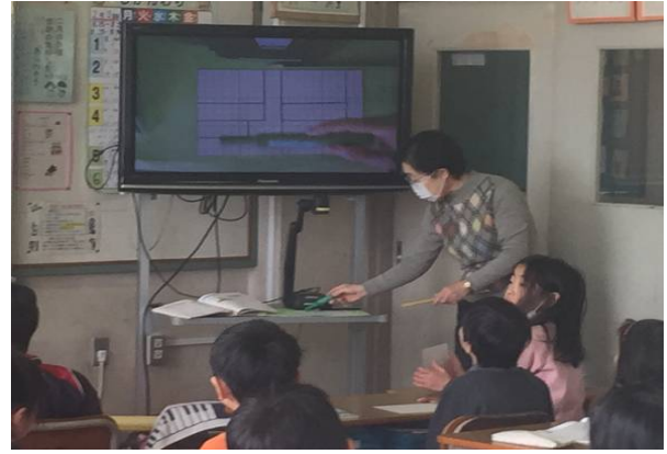
ベテラン教員も教材提示装置を率先して活用していた