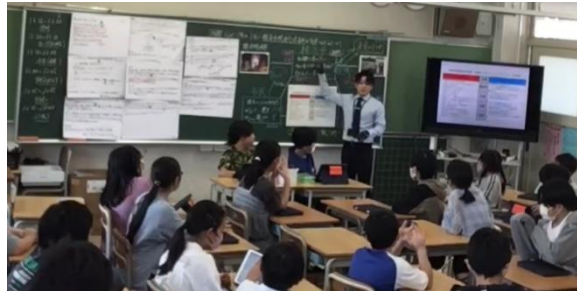
※図1 授業研究の様子

本研究の代表的な実践として、社会科の単元において協働型アクティブラーニングと一人一台端末を組み合わせた学習活動を実施した。本単元では、社会的事象を多面的・多角的に捉えることを目的とし、児童同士の対話を通して考えを深める学習活動を中心に授業を構成した。単元の導入では、資料や映像資料を提示しながら学習課題を設定し、児童が自ら問いをもつことができるようにした。その際、一人一台端末を活用して児童の疑問や考えをクラウド上に記録し、学級全体で共有した。これにより、多様な視点から学習課題を捉えることが可能となり、児童同士が互いの疑問や意見を手掛かりに学習を進める基盤を形成することができた。展開場面では、児童が司会、記録、タイムキーパーなどの役割を担いながらグループでの話し合い活動を行った。児童は資料や調査結果を基に自分の考えを整理し、ラーニングスキルを活用して根拠を明確にしながら意見を交流した。話し合いの過程では、一人一台端末を活用して各自の考えを共有し、学級全体で意見を可視化した。その後、グループでの対話を通して互いの考えを比較・検討し、学習課題に対する自分たちの結論をまとめた。