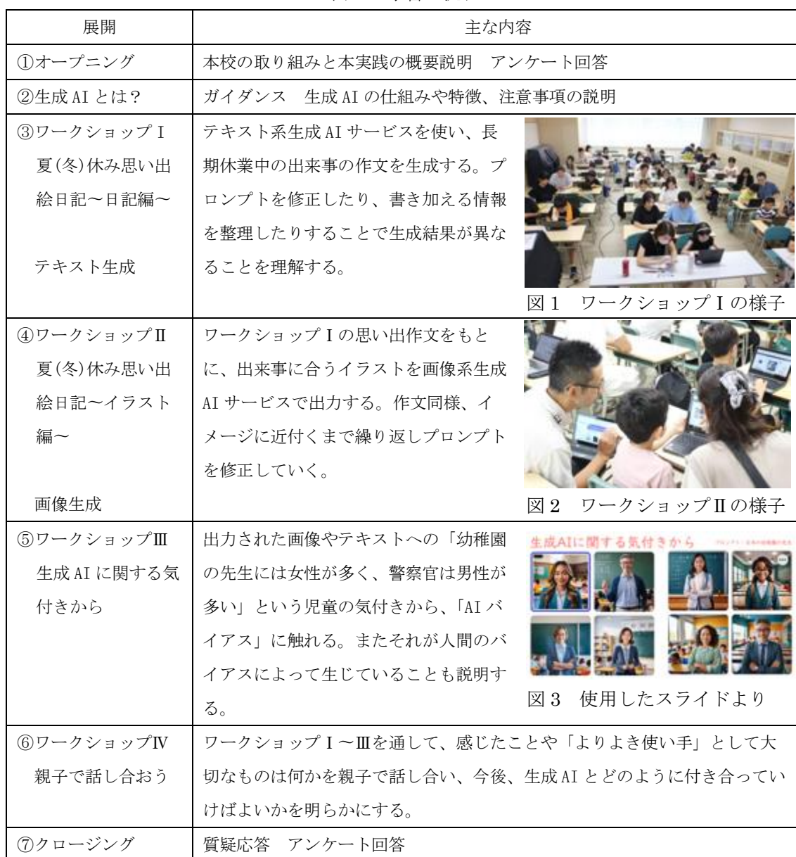
表 2 学習の流れ

テキスト生成と画像生成を取り入れ、「夏(冬)休みの思い出絵日記」づくりを取り入れた。その理由は、生成 AI による思い出子どもたちが AI の出力と自身の実体験とのずれを感じることで、ハルシネーションに気付く機会となる考えたためである。長期休業中の思い出を AI に生成させることで、実際の経験と異なる内容が含まれる可能性があり、その違いに気付くことで、情報の信憑性を確かめる視点が育つ。また、プロンプトを修正しながら自分の意図に合った文章を作る試行錯誤を通じて、生成 AI の活用に対する主体的な姿勢を促すことを狙った。