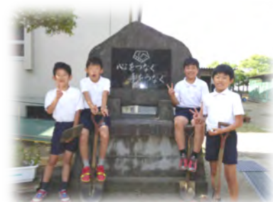
県立熊本支援学校との交流の碑の前で 「心をつなぐ 手をつなぐ」と刻まれている。

〒862-0941 熊本市中央区出水4-1-1 TEL 096-363-5671 Fax 096-375-1182 E-mail: izumiminamies@t.kumamoto-kmm.ed.jp