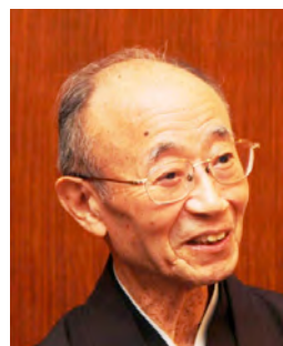
やまおり てつお 山折 哲雄 氏

1962年 東京大学法学部卒業 後、文部省入省。後に文化庁 長官、駐トルコ大使を経て 2001年4月～2003年9月まで 文部科学大臣を務める。 現在、パナソニック教育財団 理事長