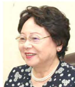
とおやま あつこ 遠山 敦子 氏

1962年 東京大学法学部卒業 後、文部省入省。後に文化庁 長官、駐トルコ大使を経て 2001年4月～2003年9月まで 文部科学大臣を務める。 現在、パナソニック教育財団 理事長