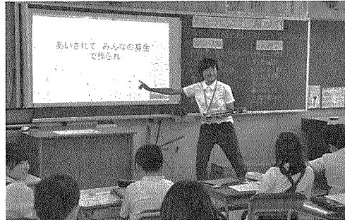
キャッチフレーズを作り、インタラクティブホワイトボードで情報の共有化を図った

4年1組の「総合的 な学習」では、愛媛県「ム」ガンバ大阪と、の同じ学校名の小学4 大阪で有名なお祭り、年生に向け、大阪の良 「天神祭」を調べた2 さを伝える「大阪キッ グループ」を発表。タプ スガイド」の作成に取 レットパソコンで作っ ち組んでいる。2目に た「ガイド」を、クラ 行われた公開授業で ス全体に披露した。