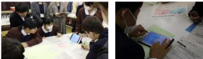
(左からタブレットによるグループ学習・タブレット内にチェックを付け確認をする)

(4) 令和元年11月22日(金)に鹿児島県の家庭科教育学習指導研究会が本校で開催された。本校家庭科職員が研究授業を担当し、タブレット端末やプロジェクタを活用した。グループ学習で実施され、タブレットを配布後、グループごとに学習内容をまとめ、タブレットで静止画撮影したものを他のグループに見せながら本時の学習内容の共通理解を図る活動であった。また、実技を伴うところで事前に動画撮影した内容をプロジェクタで紹介しながら、技術の細かな確認をした。