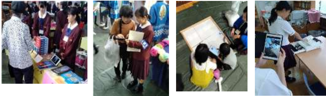
(商品紹介) (店舗案内) (ロボット体験) (事前のレジ練習撮影)

(4) 令和元年11月22日(金)に鹿児島県の家庭科教育学習指導研究会が本校で開催された。本校家庭科職員が研究授業を担当し、タブレット端末やプロジェクタを活用した。グループ学習で実施され、タブレットを配布後、グループごとに学習内容をまとめ、タブレットで静止画撮影したものを他のグループに見せながら本時の学習内容の共通理解を図る活動であった。また、実技を伴うところで事前に動画撮影した内容をプロジェクタで紹介しながら、技術の細かな確認をした。