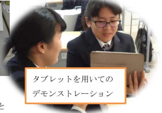
タブレットを用いてのデモンストレーション