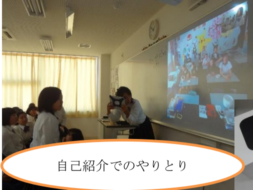
自己紹介でのやりとり

と習得を目指した。1学期は1年生を対象にクラス対クラスでの日豪語学協働学習を行った。ポイントとしては、正しい美しい日本語の提供と異文化から学ぶ国際的態度と英語でのやりとりが挙げられる。