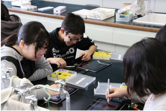
図 1 理科における実践

た小学校には小学校 5 年生算数科の多角形の作図におけるプログラミング活動や音楽科の授業として、Micro : bit を用いた鍵盤のない電子ピアノづくりを指導した。クラブ活動の指導だけを希望した学校には、初級編としてビジュアルプログラミング言語 Viscuit の指導、中級編として Micro : bit を用いた電子ピアノづくり、上級編として Micro : bit を用いた無線ラジコンカーづくりを指導した。