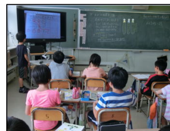
図4 3年生算数の実践

従来、書画カメラを使用して児童のノートをテレビに提示し、考え方を比較検討させる授業が多かった。本実践では、iPadを活用することで、机間指導で教師が児童と対話しながら、大事な言葉を補い、思考を表現しやすいように支援し、ノートを撮影していった。全体交流時に、撮影したノートを無線LAN経由でテレビに提示し、理解に時間がかかる児童に寄り添いながら、たくさんの児童の様々な気づきを引き出すことができた。その気づきをiPad上で提示したノートの写真に書き込み、確かめ算のしくみを理解させることができた。書画カメラによる提示よりも自由度が高く、児童の近くで対話をしながら書き込みができることは、思いのほか効果的であり、本校における提示型ICTのスタンダードといえる実践となった。