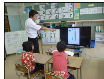
図3 タブレット PC 活用場面

約4年間をかけて、算数における習得をねらいとした自作教材データを100ファイルほど作成し、算数の学習では日常的に使用する学級が増えてきている。今年度からは、自作教材をタブレット PC から教室の大型液晶テレビに提示し、問題把握を確実にさせたり既習を基に解決の糸口を掴ませたりすることで、児童の意欲喚起に一定の成果をあげてきた。特に、少人数指導では、主に、理解に時間がかかるグループにおいてタブレット PC を使用し、「数と計算」領域を中心にフラッシュ教材を活用することで、四則計算や分数・小数の理解力に向上が見られた。また、過去のデータを利用できることや ICT 機器活用が苦手な教員が多い現状では、比較的手軽に取り組むことができるため、教員におけるタブレット PC 活用への抵抗感はなくなりつつある。このような取組については、文部科学省「第2期教育振興基本計画」による環境整備及びソフトウェアの整備にも対応し、一斉学習における提示型 ICT 活用モデルとなりうるものと考えている。今後は、他教科も含めて、自作教材データの深化・拡充を目指していく。