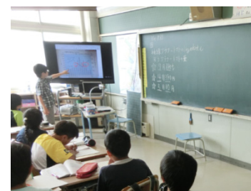
図5 4年生算数の実践

PCを使って自作しておいたグラフデータをiPadで拡大表示し、着目させたい部分や比較させたい部分を教師が線や囲みを用いて強調することで、より少ない説明で端的に指示し、グラフの特徴を理解させることができた。なお、前回の授業実践をもとに、無線LAN経由でiPad上に書き込んだデータをICT機器の設置場所に制約を受けずに提示することができたため、なかなか集中できない児童のそばで個別支援しながら授業を展開することができた。