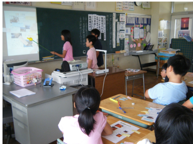
書画カメラを使ってパンフレットを説明する児童と、それを聞き入るように見ている児童

グループでの話し合い後、全体に説明する場面では、パンフレットの工夫が具体的に分かるよう、書画カメラを使ってスクリーンに映し出した。視覚的に見やすくしたことで、他のグループから質問や意見が活発に出た。「ほとんど文字だけ」というパンフレットからは、「見にくい」というマイナス意見しか出ないと思ったが、「情報量が多く詳しく調べられてよい」というプラス意見も出るなど、話し合いの充実に寄与した。