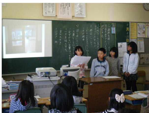
発表原稿をもとに発表するグループと、提示された資料を見ながら発表を聞いている児童

グループごとにかいた発表原稿をもとに、全体の前で発表した。発表の内容と、話し方の二つの観点でお互いに検討し合い、最後に聞いていた児童からの意見を生かし、修正して練習する時間をとった。聞いている児童は、分かりにくい点を指摘したり、声の大きさについて意見を言ったりなど、市の担当者の方への発表の際に、自分たちの思いがしっかり伝わるように、修正が必要な点を指摘することができた。その要因の一つとして、ICTを使った見やすい資料提示により、全員に情報を共有させることができ、話し合いの土俵を同じにしたからだと考える。